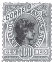
Figura 2: Selo da alvorada republicana