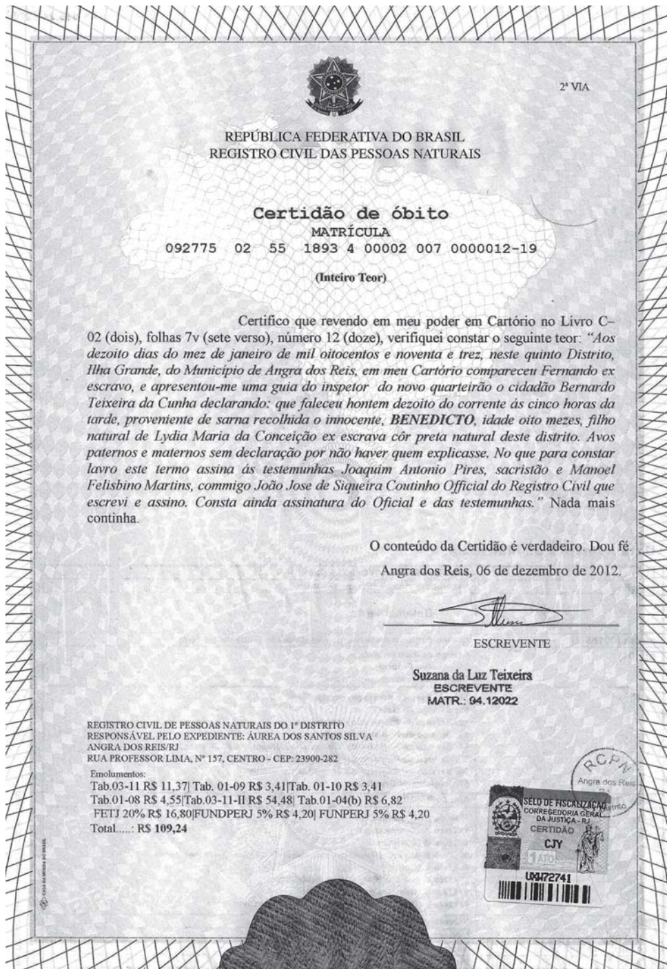
Figura 3: Atestado de óbito de Benedito, filho de ex-escrava