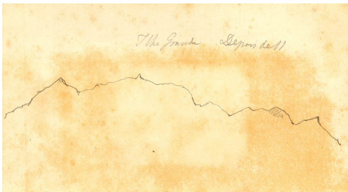
Gravuras de D. Pedro II